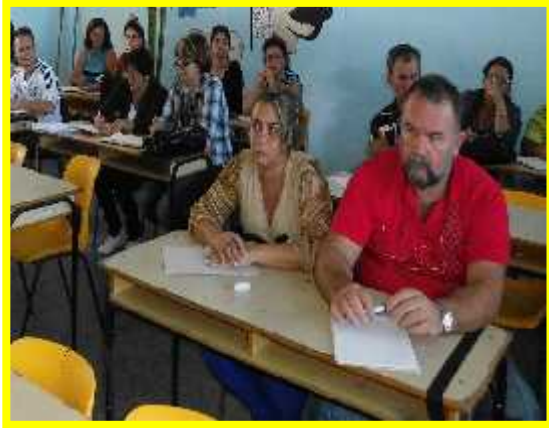
PREPARACIÓN DEL PERSONAL DOCENTE