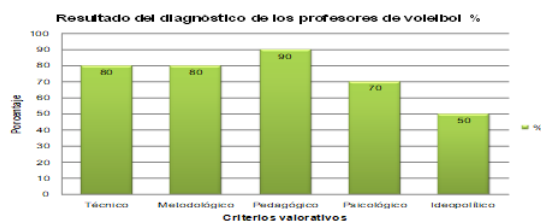
Fig. 1- Resultado del diagnóstico del capital humano, como instrumento orientado por el subsistema del deporte de alto rendimiento

En cuanto al análisis de las dificultades detectadas en el diagnóstico del capital humano, se tuvieron en cuenta cinco criterios a valorar (técnico, metodológico, pedagógico, psicológico, ideológico), como muestra la siguiente figura.