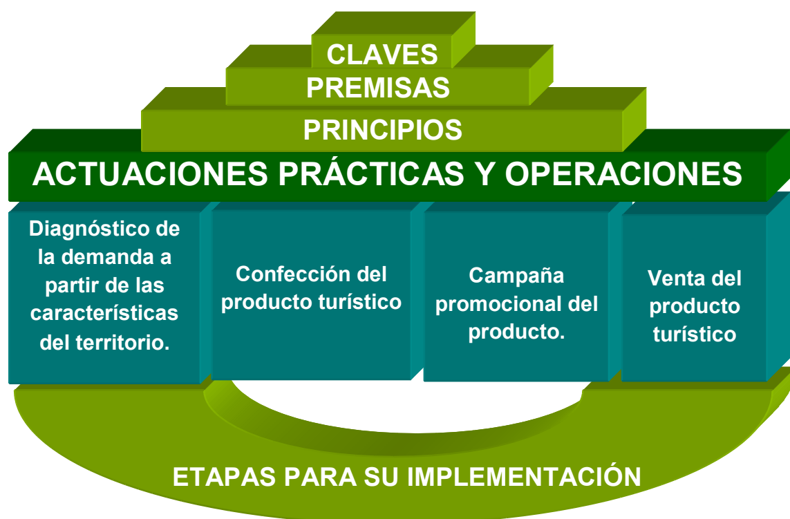
Figura 3.1 Estructura de las bases metodológicas.